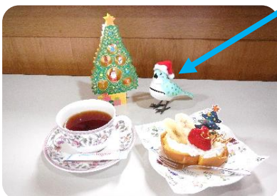
手作り(?)ケーキと紅茶で メリークリスマスです。

今回のクリスマス会は、皆さんお楽しみのプレゼント交換は見送りましたが、幸せ運ぶ青い鳥『ミュージックバード』のクリスマスソングをBGMに