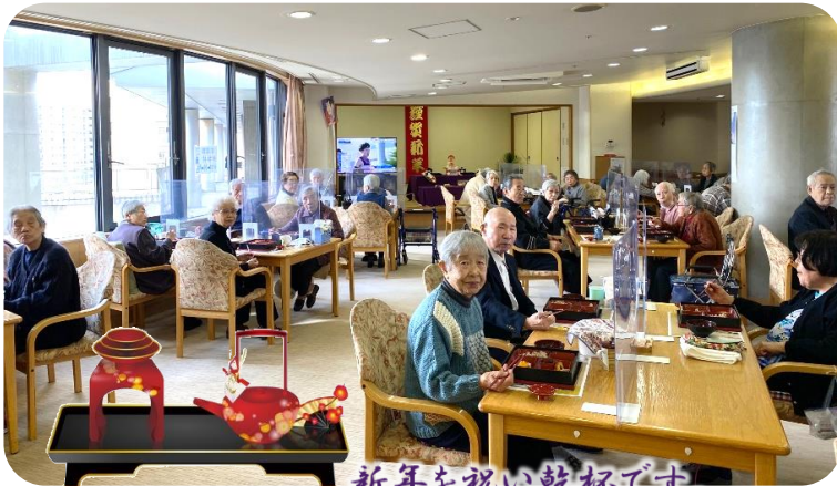
新年を祝い乾杯です。